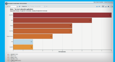
Tableaux de bord de Stormshield Network Vulnerability Manager